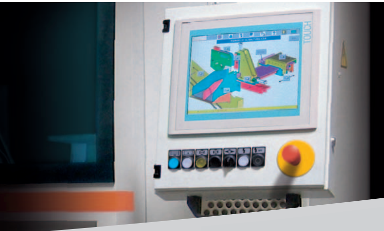
Touch Screen KASTO EasyControl