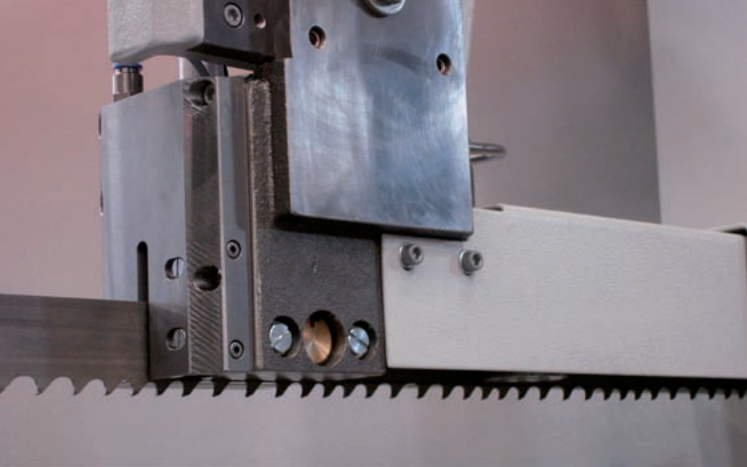
U-förmiger Bandführungskopf mit Bandfreihubeinrichtung