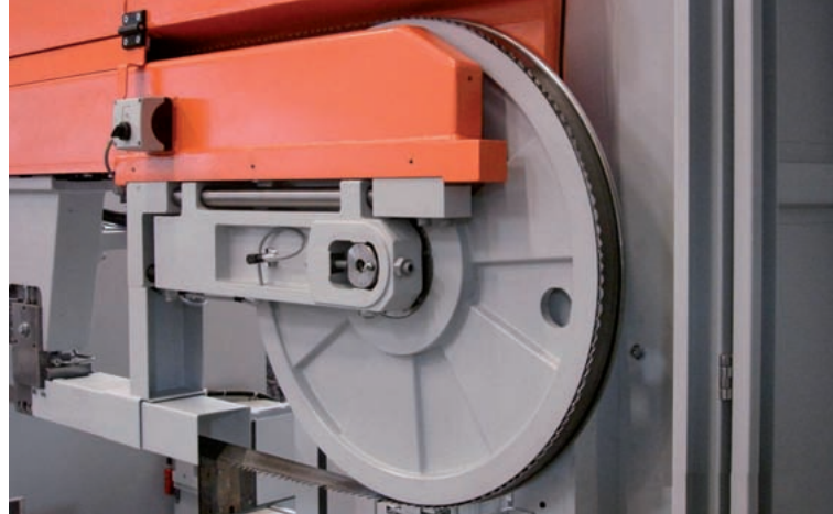
Stabiler Sägerahmen mit doppelter Laufradlagerung