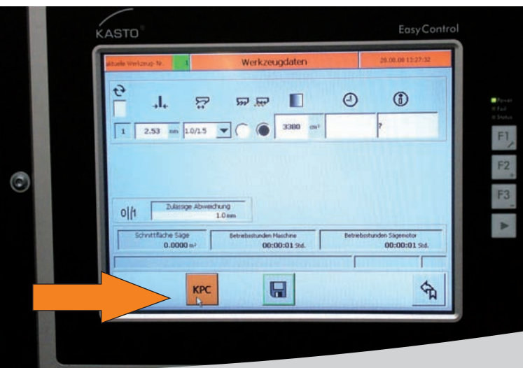
KASTO EasyControl mit KPC Technologie